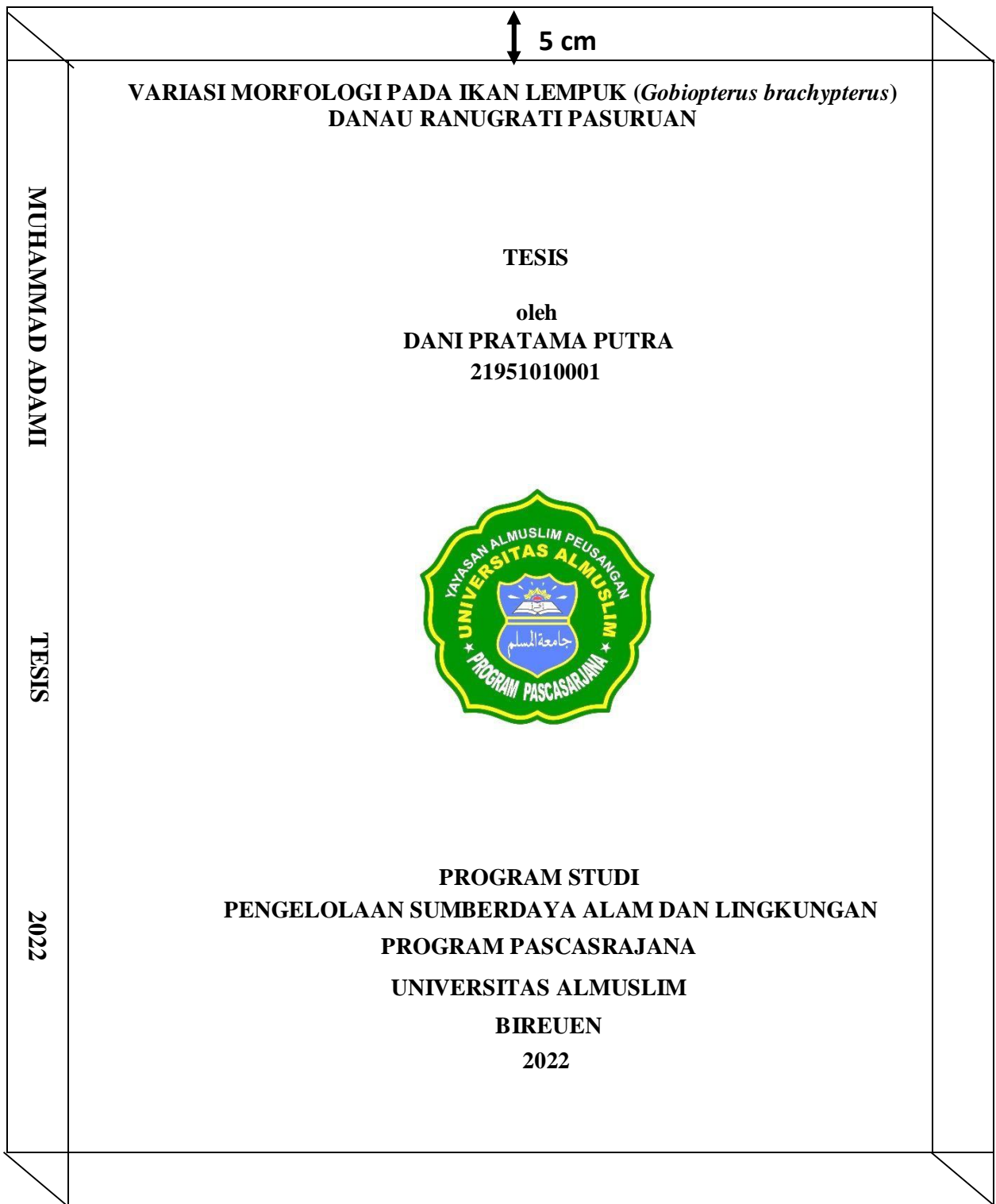
Lampiran 1. Contoh Halaman Sampul Depan Tesis (kertas warna biru muda)